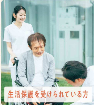
生活保護を受けている方