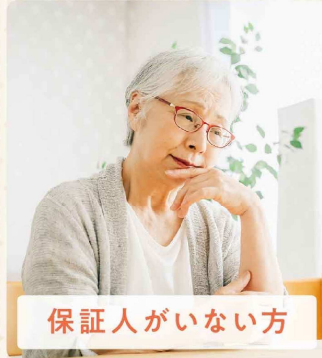
保証人がいない方